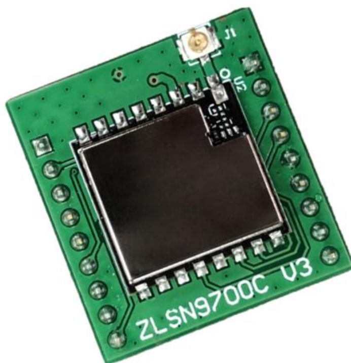
图 1 ZLSN9700C LoRa 转串口正面