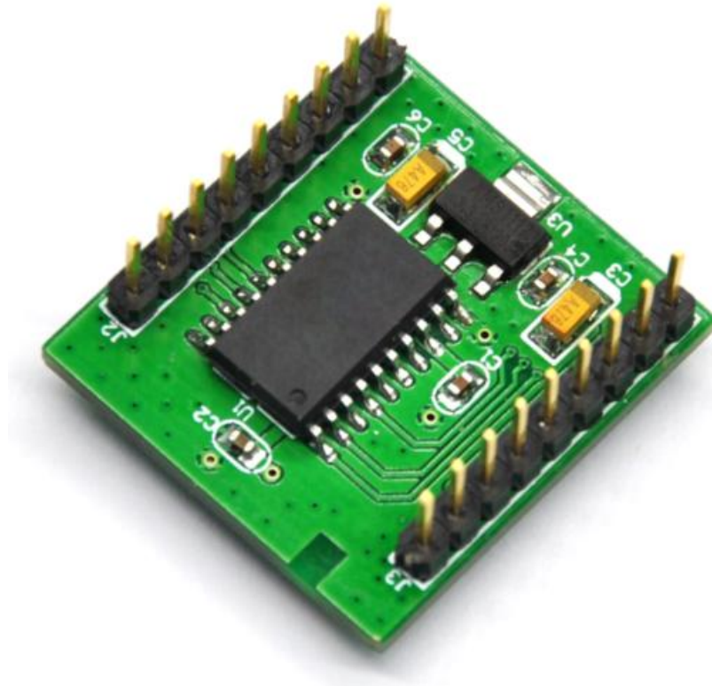
图 2 ZLSN9700C LoRa 转串口反面