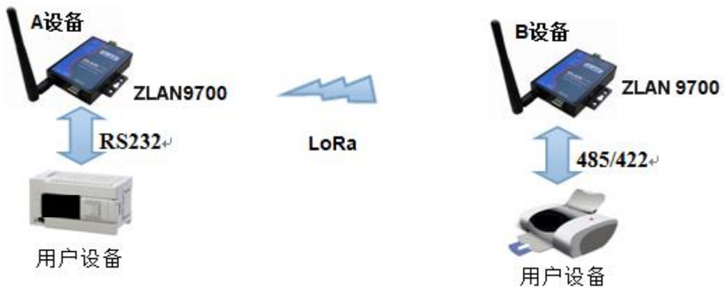
图 3 卓岚 LoRa 使用方法