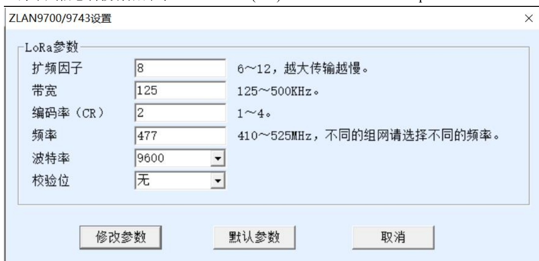
图 6 LoRa 配置界面

点击“默认参数”可以恢复到默认参数。点击“修改参数”可以将参数设置到 9700/9743 内部。下面介绍参数含义。